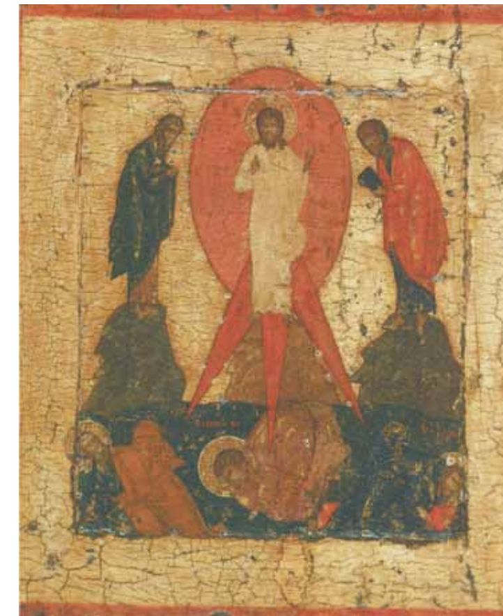
Afb2. Verheerlijking op de berg Tabor, Rusland, 30 x 26 cm, 17e eeuw