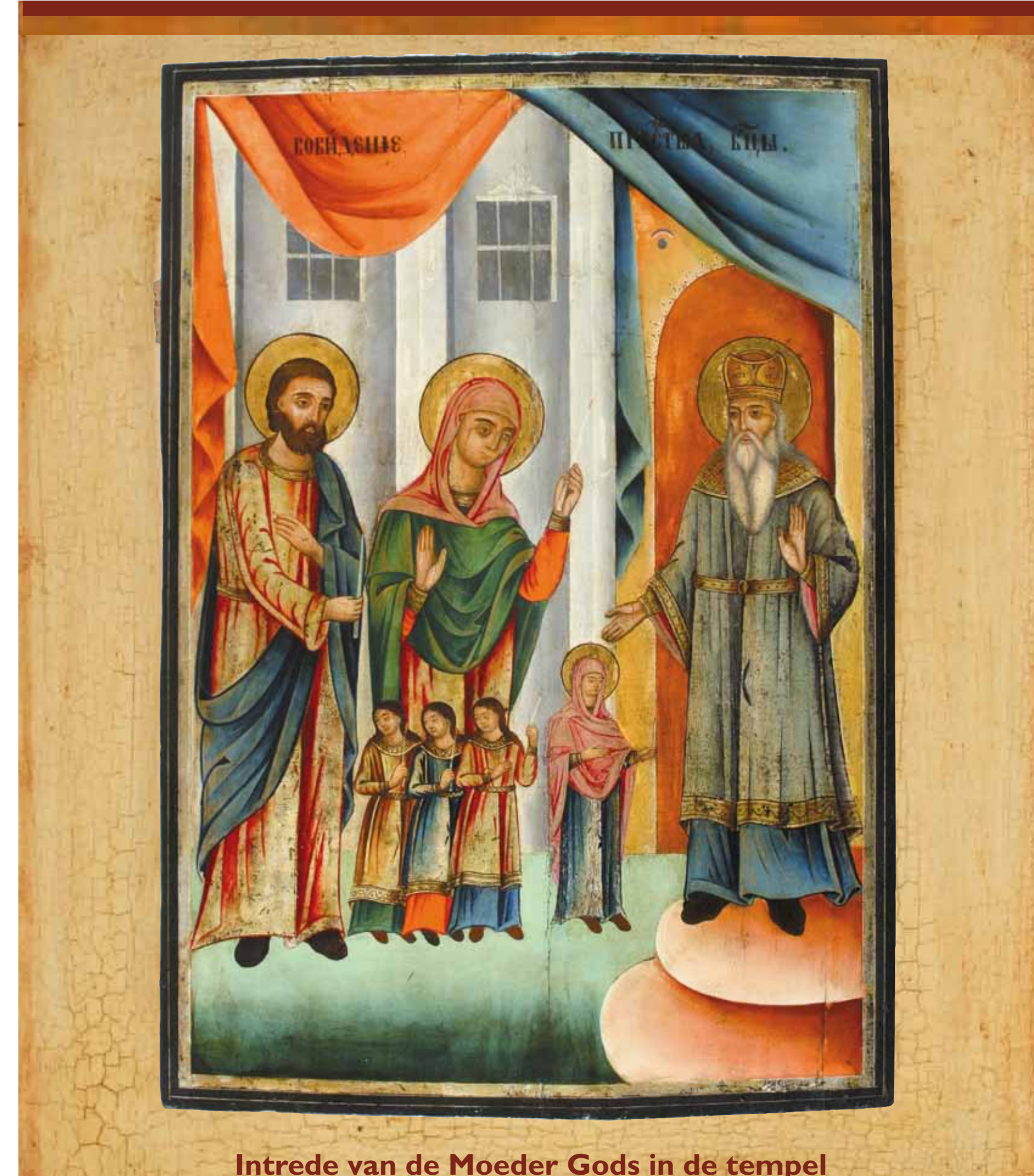
Intrede van de Moeder Gods in de tempel

Contactorgaan van de Vereniging 'Vrienden van het Ikonenmuseum Kampen'