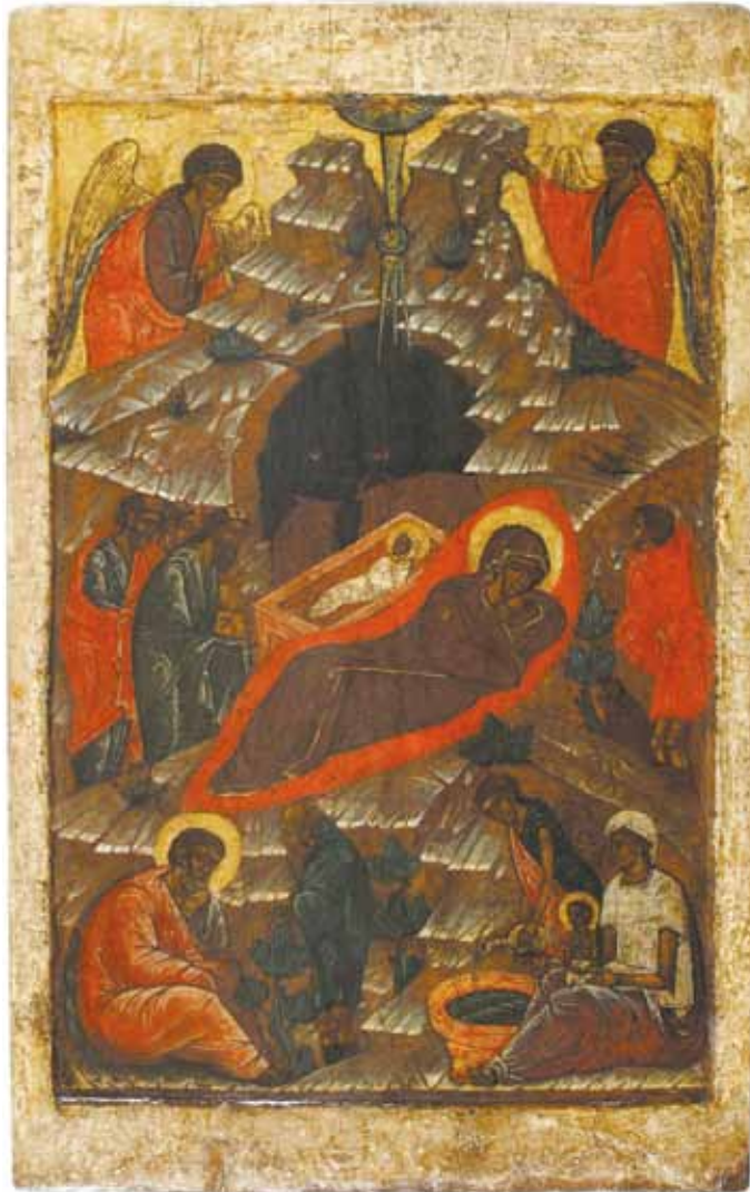
Geboorte van Christus, Rusland 16de eeuw. Museum Kampen

Pas in het Pseudo-evangelie van Matheus, daterend uit de vijfde- zesde eeuw, lezen we over een os en een ezel, die aanwezig waren bij de geboorte van Christus. De onbekende schrijver van dit Pseudo-evangelie neemt veel over uit een ouder werk, het Proto-evangelie van Jacobus, dat in de tweede eeuw na Christus is ontstaan. De beide genoemde apocriefe evangeliën, evenals andere verhalen uit het vroegchristelijke tijdperk en de middeleeuwen, gaven de gelovigen houvast. De belangrijkste van deze verhalen vonden uiteindelijk een plaats in de Legenda Aurea, samengesteld tussen 1263 en 1273 door de dominicaner monnik Jacobus de Voragine. Het is een compilatie van theologie, apocriefe werken en volkslegenden. Voor de geboorte-iconografie in de West-Europese kunst vanaf het einde van de 14de is de openbaring van Brigitta nog van groot belang. Tijdens een pelgrimstocht in 1370 werd zij in een visioen door Maria in de geboortegrot rondgeleid en op de hoogte gebracht van wat zich in de Kerst-