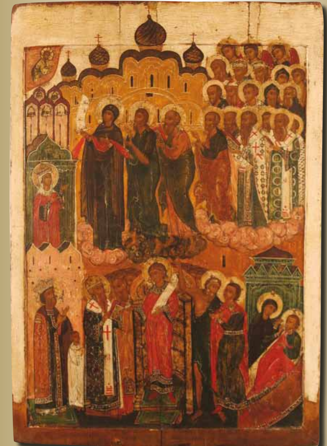
Pokrov van de Moeder Gods

Contactorgaan van de Vereniging 'Vrienden van het Ikonenmuseum Kampen'