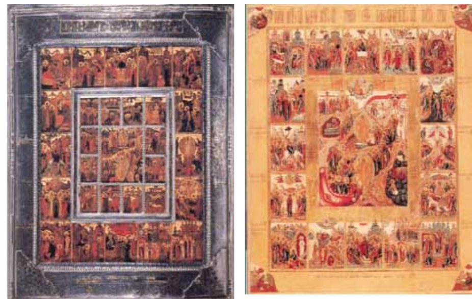
Feestdagenrij in de ikonostase