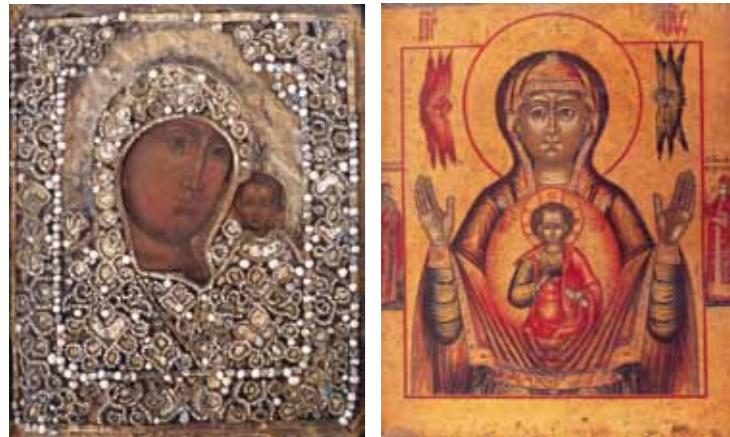
Moeder Gods Kazanskaja Moeder Gods Orante

Een grote ramp treft in 1547 Moskou, de stad brandt bijna geheel af. Om de hoofdstad van de wereld zo snel mogelijk weer het waardige aanzien te verschaffen, worden uit Duitsland, Engeland, Frankrijk en Italië, bouwmeesters, ambachtslieden, schilders en edelsmeden aangetrokken. Zij worden ondergebracht in de Wapenkamers van het Kremlin, want Rusland heeft immers geen vijanden meer. Door de invloed van deze nieuwkomers wordt de architectuur duidelijke westers, ook de meubelen krijgen westerse vormen, de boeken en atlasen uit het westen worden gekopieerd en zo verschijnen ook westerse elementen in de ikonenschilderkunst. Het perspectief doet zijn intrede, dagelijkse taferelen die als achtergrond voor heiligen en feesten dienen. Op de ikonen worden verschillende perspectiefvormen toegepast die sterk afwijken van het tegenwoordig gangbare centrale perspectief. Combinaties van verschillende perspectiefvormen op één ikoon komen veel voor: