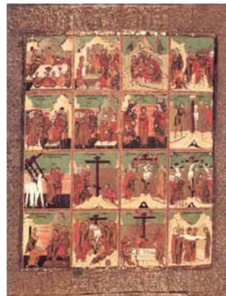
Passie van Christus

De directeur van de Wapenkamers in het Kremlin, de van oorsprong edelsmid Usakov, is als ikonenschilder beroemd geworden als de Russische Rafael. Hij schildert met licht-donker werking