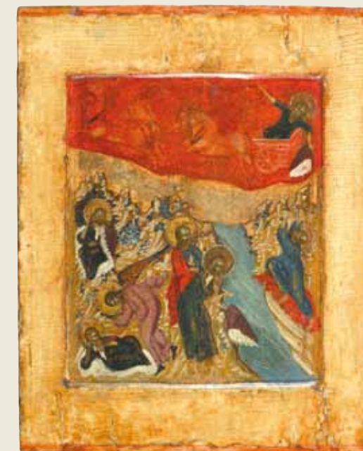
Rusland, ca. 1700 34½ x 28 cm

Ikon waarop meerdere gebeurtenissen uit het leven van de oudtestamentische profeet Elia zijn afgebeeld. Links is te zien hoe Elia neergezeten in de buurt van de beek Kerit door een raaf van voedsel wordt voorzien. Linksonder wordt Elia getroost door een engel. Midden onder slaat Elia met zijn mantel op de rivier Jordaan, om deze met zijn leerling Elisa droogvoets over te steken. De bovenste helft wordt vrijwel geheel gevuld met de voorstelling van de vurige hemelvaart van Elia. Elia is aan het einde van zijn leven niet gestorven, maar rechtstreeks naar het Paradijs gegaan, waar hij samen met Henoch de Goede Moordenaar zal verwelkomen, zoals op de ikoon van de Anastasis vaak wordt weergegeven. Vier gevleugelde paarden trekken een kar ten hemel. Elia werpt Elisa zijn mantel toe. Elia wordt in Rusland geëerd als beschermer tegen onder meer droogte en blikseminslag. Het feest van de profeet Elia wordt op 20 juli gevierd.