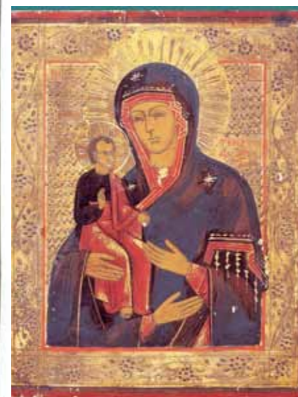
Moeder Gods van Vladimir

In Novgorod ontwikkelt zich ook de ikonostase, de beeldenwand tussen de gelovigen in de kerk en het Heilige der Heiligen. In de Byzantijnse traditie vormt een laag hekwerk, het templon, (Gr. afsnijden, afzonderen) de afscheiding. In het boek Exodus 26,26-34 is al sprake van een dergelijke afscheiding, waarachter de ark geplaatst kan worden.