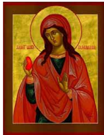
Maria Magdalena met rood ei

Het was in het voorjaar dat ik deze bijzondere kerk bezocht. Vanuit de bedrijvigheid in de Goodramgate opeens de stilte binnen. Op het kerkhofje bloeiden tussen de rustieke zerken en stèles de hyacinten naar hartenlust. De oude boom even terzijde van de ingang was nog bladloos, de stam en de warrige takken vertelden het verhaal van gelovigen door de eeuwen heen, die in de Holy Trinity troost en bemoediging zochten. De naar rood zwemende kerkmuur van grillige bakstenen was een volmaakte achtergrond. Ik zakte op een wiebelige bank neer en verbaasde me over zoveel doorleefde schoonheid. En al was dit alles omsloten door oprukkende nieuwbouw, en al waren de geluiden van de Goodramgate goed te horen, het was mogelijk je van alles af te sluiten. Verveerde grafstenen, onleesbare namen en vogels die ritselden tussen dood blad. Twee jonge vrouwen namen plaats op een muurtje en begonnen hun lunch. Langzaam stond ik op en ging eerbiedig de kerk binnen. Aan de ingang stond een stoeltje, een gebarsten koffiekop was er half onder weggeschoven. Binnen was het stil, de suppoost had zich kennelijk teruggetrokken in goed vertrouwen. Was de buitenkant alleen al een bezoek waard, de binnenkant was dat mogelijk nog meer. Er leek iets tussen banken, altaar, preekstoel en biechthokjes te zweven, wat ik niet kon benoemen. Had het te maken met de naam van de kerk: de Heilige Drie-eenheid? Kwam