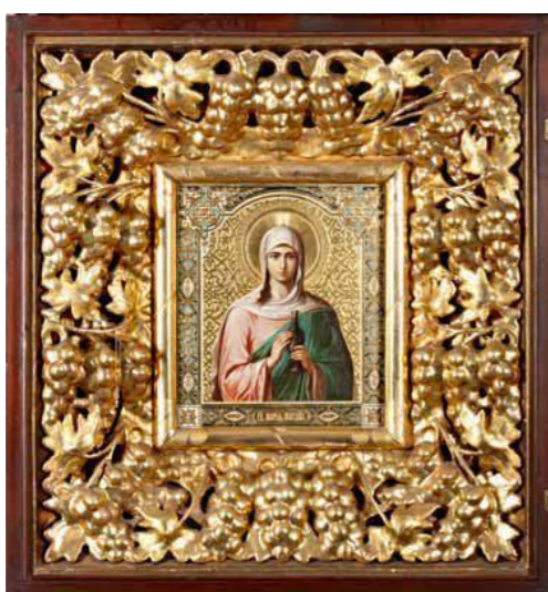
Icoon uit bezit Anna Paulowna

Code' van Dan Brown. Diepgravende studies op basis van de oude bronnen, maar ook oude legendes, zoals deze uit de 4e eeuw die verhaalt dat Maria Magdalena de heilige graal naar Frankrijk gebracht zou hebben, leidden ons naar 'andere waarheden' en fascinerende veronderstellingen naast de formele waarheid van het kerkelijk gezag. Uiteraard heeft ook de feministische theologie zich ontfermd over Maria Magdalena. Het voert te ver om in het kader van dit artikel dieper in te gaan op deze zoektochten, maar interessant zijn ze wel.