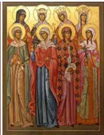
Maria Magdalena met albasten kruik en ei