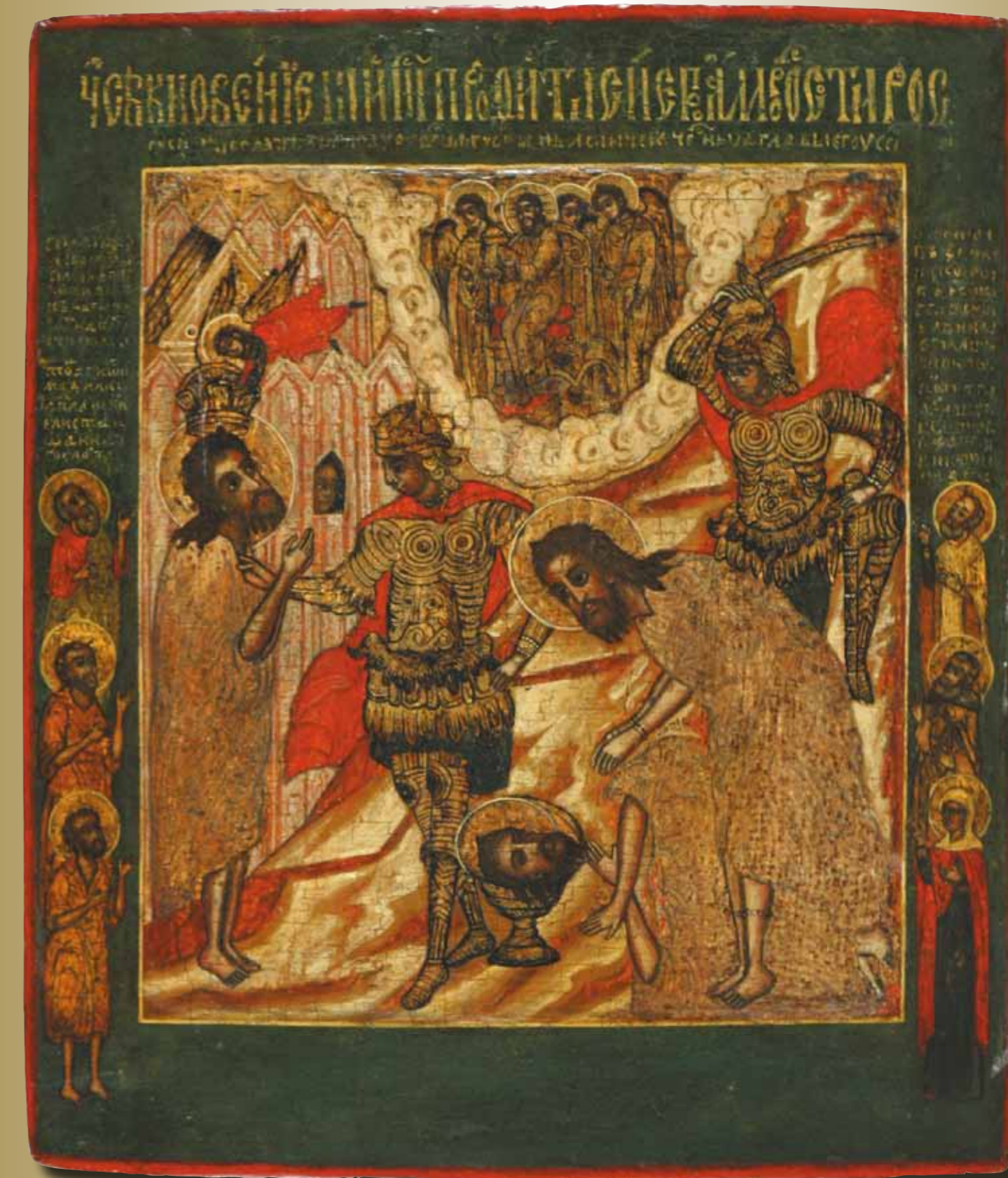
Onthoofding van Johannes de Voorloper

Contactorgaan van de Vereniging 'Vrienden van het Ikonenmuseum Kampen'