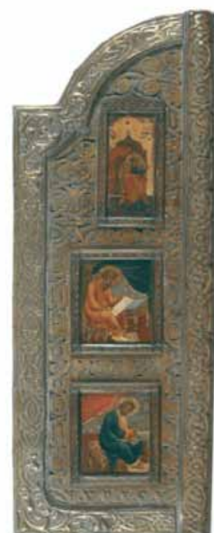
Ikonostase kerk Moeder Gods Smolensk