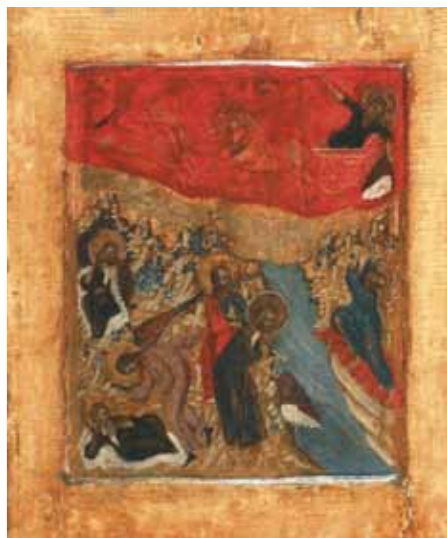
Vurige hemelvaart van Elia