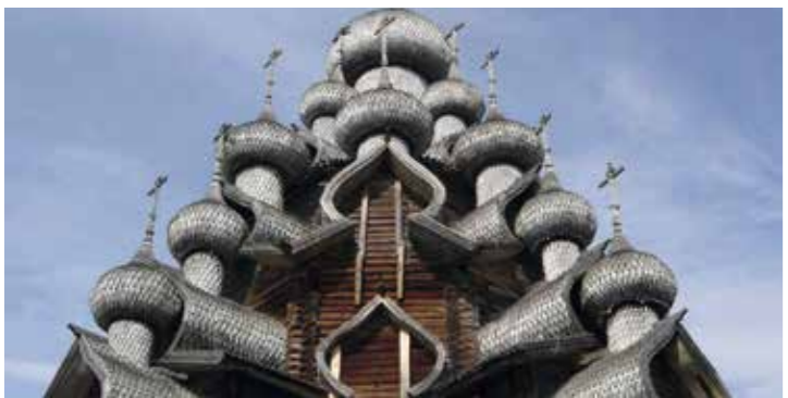
De koepels van Preobrasjenskajakerk

Het meest opvallend binnen de Pogost is de Preobrasjenskaja- of Transfiguratiekerk. Deze grote kerk, een zogenaamde zomerkerk, wordt niet verwarmd. In de winter worden er dan ook geen diensten gehouden. De winters in dit noordelijk deel van Rusland zijn lang en heftig.