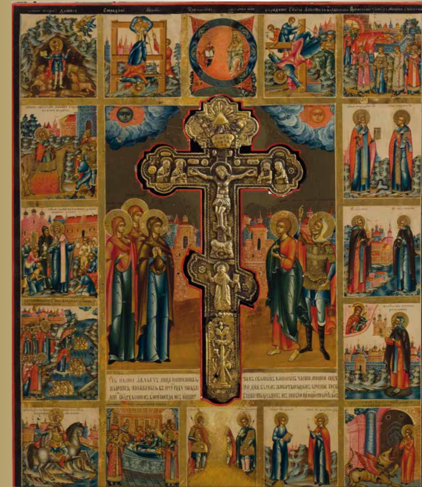
Staurotheek, wonderverrichtende ikoon

Contactorgaan van de Vereniging 'Vrienden van het Ikonenmuseum Kampen'