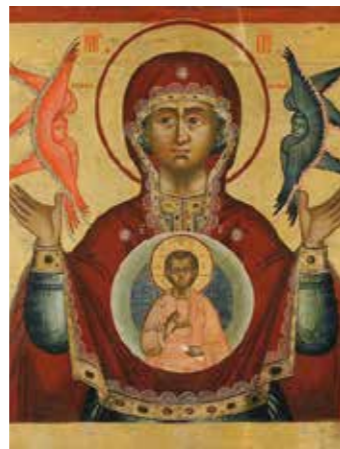
Moeder Gods van het Teken. De Moeder Gods in orante (bidende) houding; een Byzantijnse gebedshouding. Voor haar Christus Immanuel.

De tweede kerk, de Pokrowskajakerk, is gebouwd in de tweede helft van de achttiende eeuw. De kerk heeft 9 koepels waarvan de negende zich recht boven het altaar bevindt. De ikonostase in deze kerk is niet meer oorspronkelijk maar samengesteld uit van elders afkomstige ikonen, waarvan sommige ouder dan de kerk zelf. Deze kerk binnen de omheining wordt wel verwarmd. Het is een winterkerk waar diensten gehouden worden van 14 oktober tot Pasen.