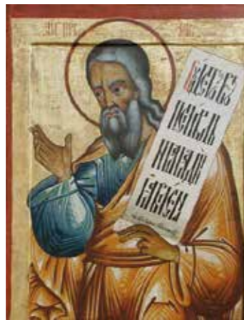
Jesaja (Jesaja 7:14: Daarom geeft de Heer zelf u een teken: Zie de maagd zal ontvangen en een zoon baren en hem Immanuel noemen. )

De ikonostase in de kerk bestaat uit vier niveau's, bevat 102 ikonen en stamt uit de tweede helft van de achttiende eeuw. De ikonen komen uit drie verschillende perioden. De oudste twee, de transfiguratie en de Pokrov zijn 17de eeuws en volgens de noordelijke stijl geschilderd. De centrale ikonen komen uit de tweede helft van de 18de eeuw, eveneens geschilderd in de lokale stijl. De meeste ikonen uit de bovenste 3 rijen zijn uit de late 18de eeuw en afkomstig uit verschillende delen uit Rusland.