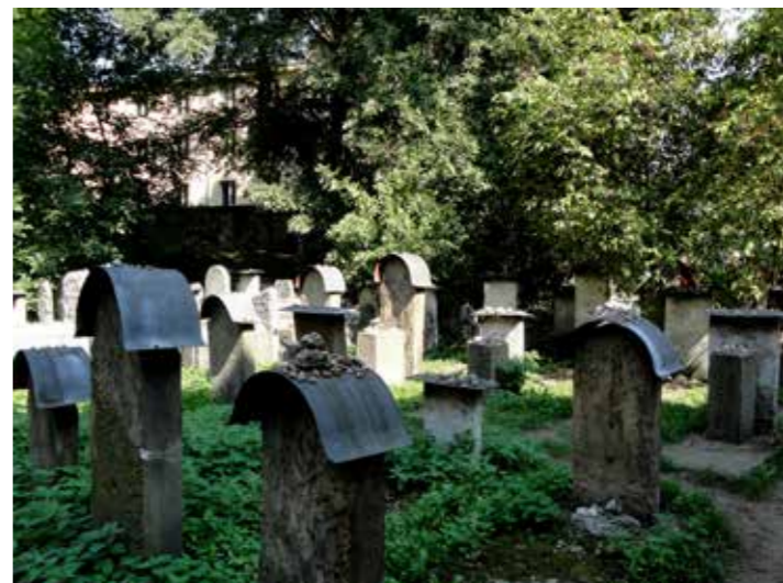
...een boogvormig dakje

Haar naam dankt ze aan rabbi Moses Isserles, Remu'h genoemd, en zoon van de stichter. In W.O II roofden de Duitsers alle kostbaarheden en gebruikten het gebouw als opslagplaats voor lijkenzakken. Dat laatste geeft een 'zwaar' gevoel bij het betreden van de synagoge. Ooit was de kerk bedoeld voor intimi van de stichter. De kast met gebedsboeken lijkt hierover te vertellen. Een gids begeleidt een groep Engelsen, wijst naar de bima (spreekgestoelte) en de polychrome deur met twee pan-