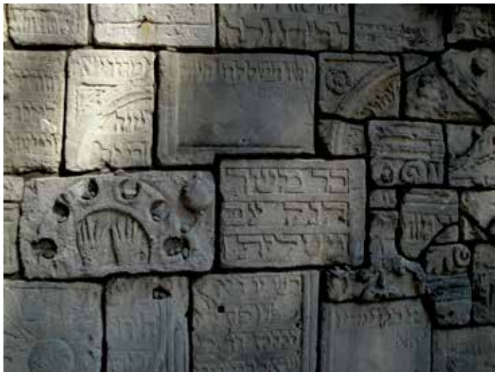
Gespreide handen lijken te zegenen

elen en vervolgens naar de menora met bovenop een kroon en symmetrische schilderingen. De groep vertrekt, nieuwe bezoekers komen binnen. We zoeken de stilte en gaan naar de er naast liggende begraafplaats. Beelden van de joodse begraafplaats in Praag komen boven, maar dit kerkhof is intiemer, zo vol gewijzheid; de stilte is aantrekkelijk. Wandelen langs de grafstenen, onbegrepen teksten lezen, kijken naar wonderlijk lage 'tomben'. Vrijwel alle stenen hebben een boogvormig afdakje, waaronder meerdere kiezels liggen. Deze traditie is ontleend aan de Bijbel, waar graven in de woestijn van Palestina met keien werd gemarkeerd zodat voorbijgangers ze herkenden. Zelf laat ik vaak een kiezel achter als groot.