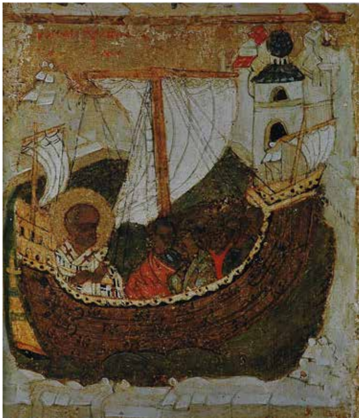
Aankomst in het Heilige Land

Wat wel van belang is, is dat de beide schepen duidelijk van elkaar verschillen en vertegenwoordigers zijn van de twee belangrijkste typen van vrachtschepen, die in de late Middeleeuwen het gezicht van de zeehandel bepaalden. Een Hulk bij 'de aankomst in het Heilige Land' en een Kogge op de ikoon 'Storm op zee'. Dat betekent dan weer, dat de schilder gefascineerd moet zijn geweest door schepen en anderen via zijn ikoon van het verschil tussen de beide typen op de hoogte wilde stellen. Dat lijkt mij de enige zinnige reden te zijn waarom de eerste afbeelding op de vita-ikoon terecht is gekomen. We mogen daarom