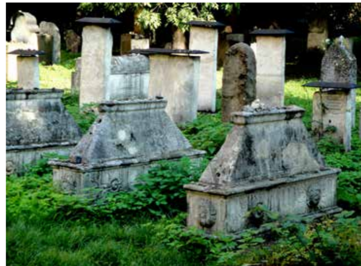
Wonderlijk lage tomben...

De gids brengt ons naar een omsloten plein, waar de horeca zich in alle kleurigheid gastvrij aanbiedt. De omliggende huizen werden ooit bewoond door uitsluitend Joden. Toen hield het op, Hitler en trawanten deden hun werk grondig. Het gebeuren staat schril op de kleurige beelden van nu. De taak van de gids zit er op, we maken een plan voor de rest van de dag en kiezen voor een bezoek aan één van de vele synagogen. Het wordt de Remu'hsynagoge om de geschiedenis en om de bijbehorende begraafplaats. Voor de synagoge zit een jongeman achter een tafel. De toegangsprijs is 5 zloty (€ 1,30), een keppeltje is verplicht. De geschiedenis van deze synagoge is indrukwekkend. Gebouwd in 1558 op de plek waar voordien een houten synagoge stond.