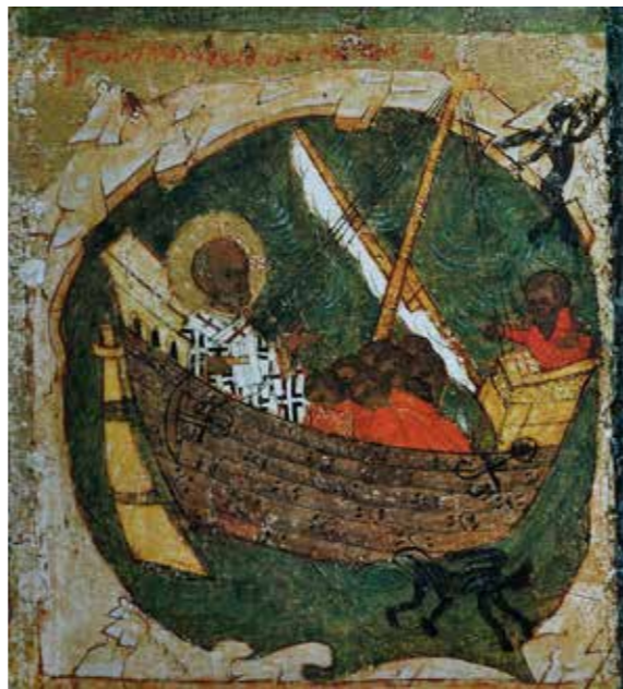
Storm op Zee

wel stellen dat de ikoon afkomstig is uit een gebied waar de handel tussen Rusland en het Westen floreerde en dat moet dan wel in de buurt van Novgorod zijn geweest, alwaar een belangrijke handelspost van de Hanze gevestigd was. Maar het bijschrift in de catalogus vermeldt Tver als plaats van schildering en als ontstaansdatum ± 1526. Ik zie geen redenen hieraan te twijfelen, maar Tver ligt zelfs voor Russische begrippen vrij ver van Novgorod en de zee vandaan en in 1526 speelden koggen en hulken geen al te grote rol meer in de handel. Waarschijnlijk heeft een schilder in Tver bij het schilderen als voorbeeld gebruik gemaakt van de ikoon uit Novgorod, die hem op welke wijze dan ook bekend was. Hoe dit ook zij, dat hij juist deze ikoon als voorbeeld heeft gebruikt, toont aan dat fascinatie voor schepen en ikonen elkaar niet per definitie uit hoeven te sluiten.