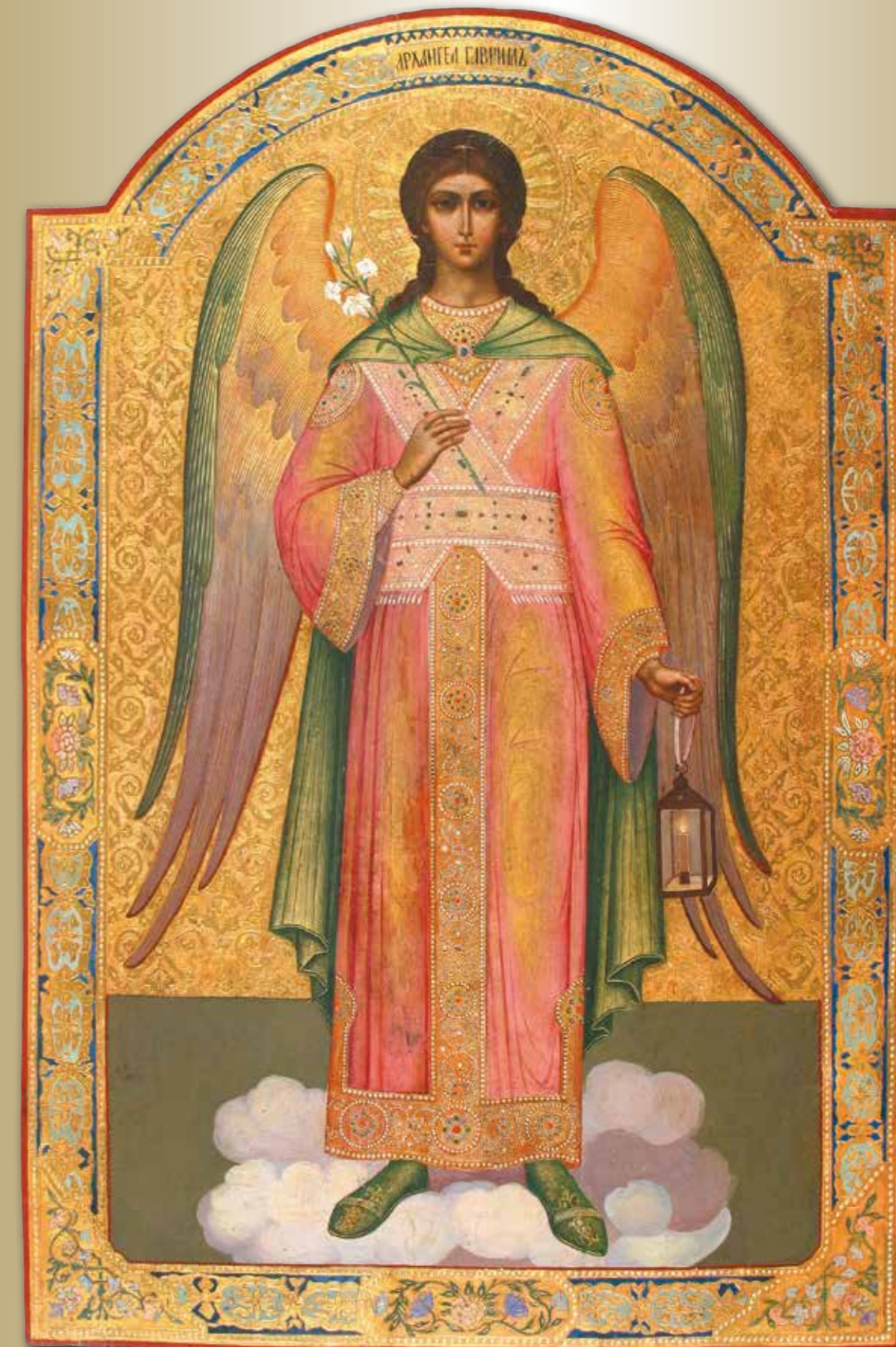
De Aartsengel Gabriël

Ontwerp en drukwerkbegeleiding Studio-88 • Buiten Nieuwstraat 132 • Kampen • www.studio-88.nl