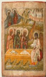
De Mirredragende vrouwen bij het graf van Christus Rusland, 17e eeuw; 88 x 72 cm Ikonenmuseum Kampen

Centraal staan de vrouwen, die het lichaam van de gestorven Christus willen balsemen. Aan het hoofdende van het graf zien zij een engel die hen de blijde boodschap van Christus' opstanding verkondigt. De doeken, waarin de gestorven Christus was gewikkeld, liggen nog in het graf. Enigszins in de achtergrond is te zien hoe Christus aan Maria van Magdala verschijnt in de hof waarin het graf is gelegen. Deze voorstelling, genaamd Noli me tangere (raak mij niet aan), wordt ook wel afzonderlijk op ikonen afgebeeld. Nog verder op de achtergrond is de stad Jeruzalem voorgesteld. De begraafplaatsen bevinden zich immers altijd buiten de stadsmuren. Het moment, noch het feit van Christus'