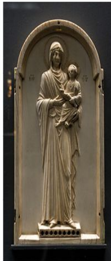
Hodegetria, 10e eeuw, ivoor