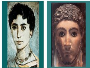
Portret jonge vrouw 2 e eeuw v. Chr.

Encaustische portret-ikonen uit de zesde en zevende eeuw vertonen nog de levenscheitheid die kenmerkend is voor het hellenisme (afgeleid van Hellas, de Griekse naam voor het vaderland).