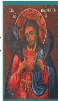
Christus de Goede Herder Rusland 18e eeuw

(vervolg 'Ikonen: een geschiedenis') de huiskerken en de catacomben. Het christendom is dan een geloof van taal en boeken. Het beeld wordt vooral snog vermeden, omdat het herinnert aan de heidense gewoonten van beeldverering. Wel gebruiken ze symbolische tekenen, zoals vissen, palmtakken, druivenranken, vogels zoals de duif en de pauze. De ingewijden weten deze tekenen te duiden, de vis als