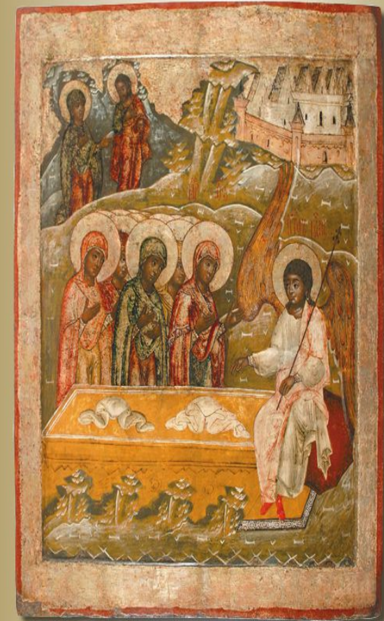
De Mirredragende vrouwen bij het graf van Christus